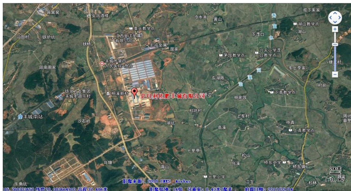
图 2.4-1 项目地理位置图

据实地调查，项目厂址位于丰城循环经济园区内，东面为桥东镇康里酆家、南面为忻润电镀科技园、西面为园区道路、北面为江西恒泰金属材料有限公司。建设项目地理位置图见图 2.4-1 所示。